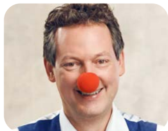
Eckart v. Hirschhausen